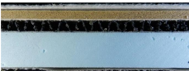
IR-IVAT55 の断面写真 (縮尺：1/2)