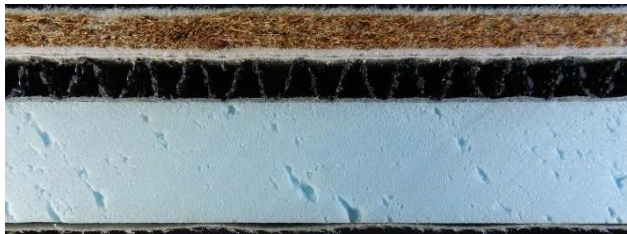
IR-III' AT55 の断面写真 (縮尺：1/2)