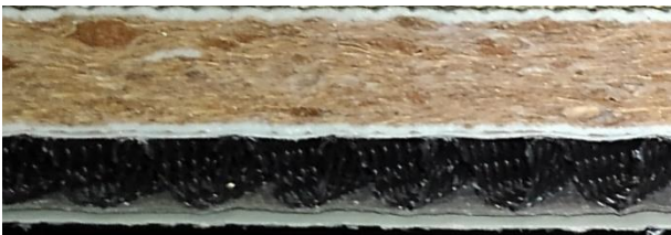
IR-ⅢAT30 の断面写真 (縮尺 : 1/1)