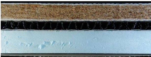
IR-ⅢAT55 の断面写真 (縮尺：1/2)