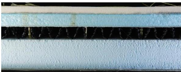
IR-I AT55 の断面写真 (縮尺：1/2)